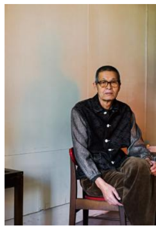
この紙はリサイクルできます

お問い合わせ せんだいメディアテーク 企画・活動支援室 〒980-0821 仙台市青葉区春日町2-1 Tel: 022-713-4483 FAX 022-713-4482 Mail: artnode@smt.city.sendai.jp