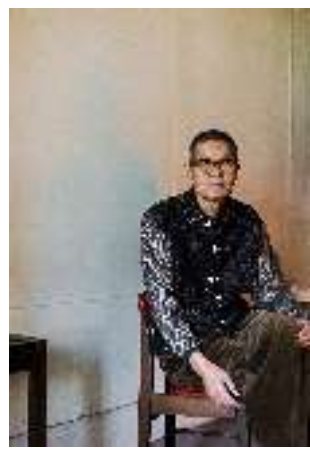
この紙はリサイクルできます

お問い合わせ せんだいメディアテーク 企画・活動支援室 〒980-0821 仙台市青葉区春日町2-1 Tel: 022-713-4483 FAX 022-713-4482 Mail: artnode@smt.city.sendai.jp