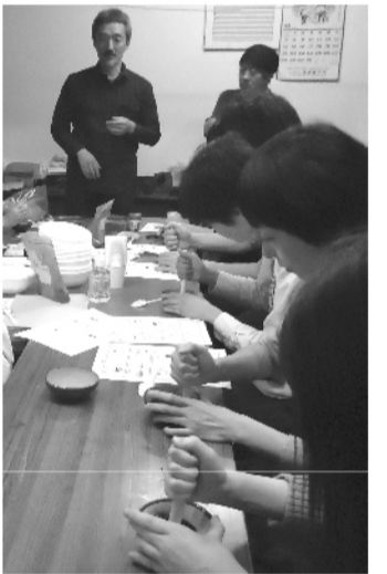
ゴリゴリ砕いて粉にする

昔の話でケムに巻く!? ワークショップ レシピ紙上公開 「亜炭の頃」を知る世代にとって、煙とニオイは郷愁のスイッチ。知らない世代にとっては煙だけにさながら地域史の玉手箱。話には聞けれど実際どんなニオイなの?とお思いの方に朗報です。広瀬川あたりに落ちている亜炭を少し加工すれば、いつでも卓上で昭和の仙台風景を再現できます。その名も「亜炭香」。